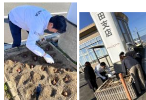
慣れない素人が150個を植えました