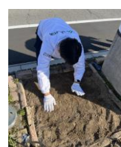
まだまだ芽が出るのは先になりそうです！全部芽が出るか心配です。