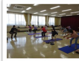
接骨院の先生が 教える体操教室

今年度は、通年開催で行われている体操教室や生け花、筆ペン教室を開催することができました！また、産地応援プロジェクトとして、南部・北部にて寄せ植え教室をおこないました。詳しくは裏面の活動予定一覧をご覧ください。来年度も開催を予定しておりますので気になる方はぜひご参加ください♪