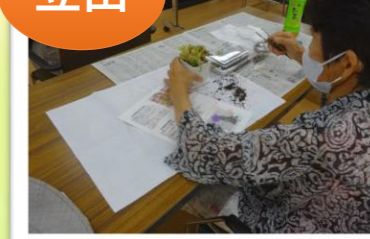
多肉植物寄せ植え教室