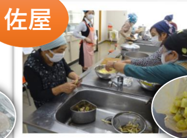
鬼まんじゅう作り

(※料理教室につきましては令和5年度上半期の活動を見合わせておりますのでご了承ください。)