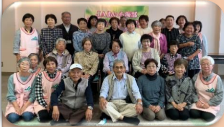
参加者とたすけあいの会の皆さん

たすけあいの会「活いきサロン」開催 10月16日(水)立田北部コミュニティセンターにてたすけあいの会「活いきサロン」が18名の参加者で開催され、当日はペン立て作りやゲームなどで楽しい時間をすごしました！