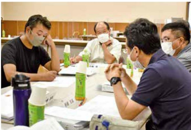
話し合いを行う参加者

第2講では、当JAの現役の理事4名がアドバイザーとして参加し、地域農業やJAの課題解決に向けてグループディスカッションを行いました。理事がグループディスカッションに参加するのは初めてです。受講生は自身がJAの理事になったと仮定し、農家所得の向上や産地発展などの農家の願い実現とJAの持続可能な経営基盤の確立の両面から討議を深めました。