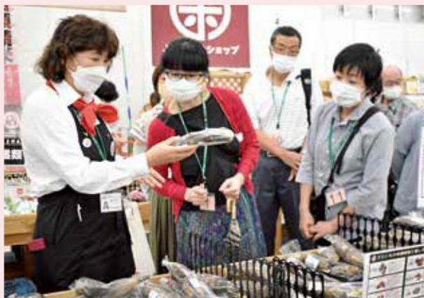
直売所を案内する職員

募集は当JAの公式LINEや店頭ポスターで行いました。全5回の開催の中では、JAの事業や産直施設、農業振興、自己改革などに関する准組合員の声をアンケートを通じて聴くほか、農家ほ場の見学、みらいキャンパスの参加者との意見交換会を予定しています。