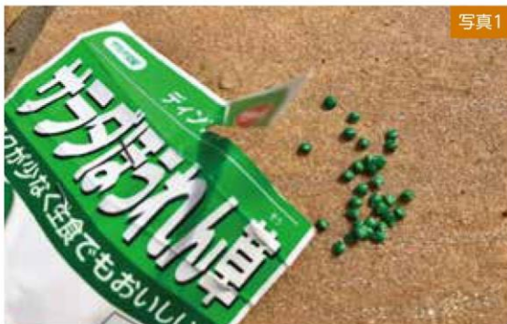
写真1 資材で覆われています。

このような種はコート種子と呼ばれ、着色剤とともにベンレートなどの殺菌剤を加えた粘土