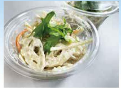
「あいち県産れんこん シャキシャキ胡麻マヨサラダ」