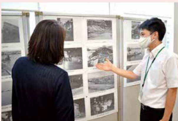
写真を紹介する職員

記録写真は、愛知県の協力により当JAが預かった中から22種類を各支店で展示しました。県内でも特に被害の大きかった海部地域を撮影した写真には、被災地や避難場所の様子、そこで復興に携った人々の姿が記録されています。台風の経験から当JAの南部地域では「あきたこまち」「コシヒカリ」などの早期栽培が進み、県下で最も早く米の収穫が行われます。