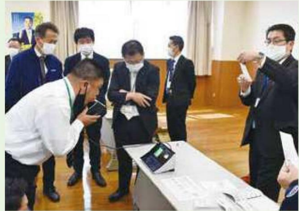
講習会でアルコール検知器を操作する職員

3月28日、本店でアルコール検知器の使用に関する講習会を行いました。昨年6月に千葉県で起きた事故をきっかけに今年10月よりアルコール検知器による確認が義務化され、当組合においても交通法規の順守のため今年度より検知器の導入がはじまりました。