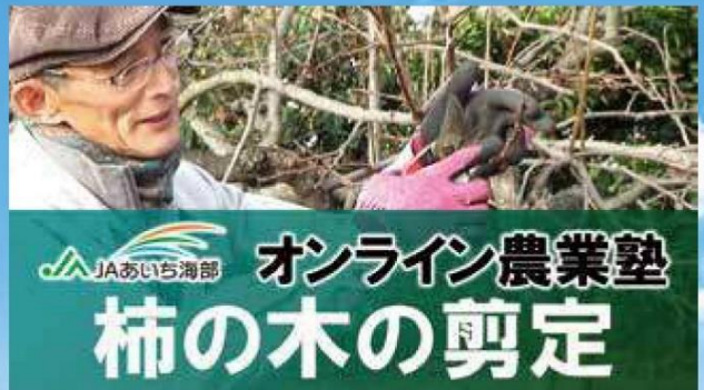
YouTubeで公開している動画

JAあいち海部では「農」を基軸として、地域の皆さまの生活に役立つ情報をYouTubeにおいて発信するとともに、当組合のファン獲得に努めております。