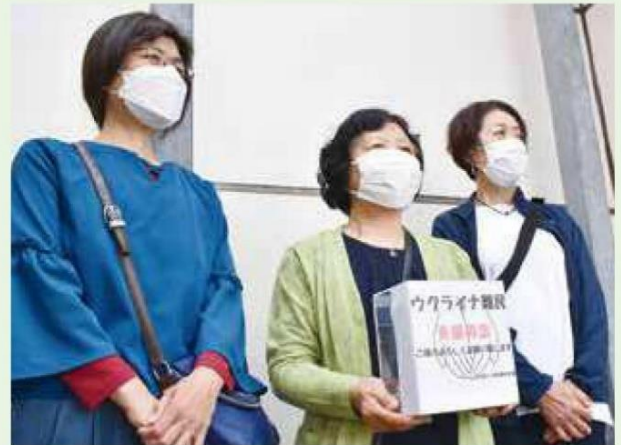
募金を募る女性部員

同部では社会貢献を目指した支援活動を展開しており、ペットボトルキャップの回収によるワクチンの寄付なども行っています。平成20年度から現在までに約10,500kgを搬出し、5,250人分のワクチン寄付を実施しました。