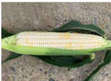
シルバー系の品種におきたキセニア

トウモロコシは、雌穂の先から伸びた絹糸(粒の数と同じ本数に飛んできた花粉が着いて受精し、各粒が生長する風媒花です。スイート種に他の種類(デントコーンやポップコーンなどはスイート種に対して優性)の花粉がかかって受精するとその粒は花粉親の性質が出て、硬化したり甘くなくなります。これをキセニアといいます。同じスイート種のなかでも白は劣勢で、白色粒をもつシルバー系品種に黄色の花粉がかかって受精するとキセニアが起こってその部位は本来の白ではない黄色粒となります。絹糸の受精能力は10〜15日間継続するため、半月以内で開花時期が重なる場合、異なる種類は300〜500m以上離して作付ける必要があるといわれています。