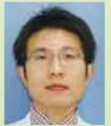
第一呼吸器内科部長

無症状で健診の胸部レントゲン写真の異常をきっかけに診断される方も多いですが、咳や痰、血痰・咯血、進行すると