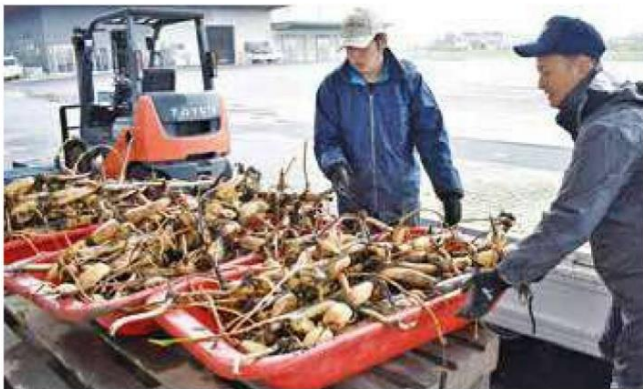
収穫したレンコンを確認する職員

調査に参加した職員は「産地としての向上を目指して今後も継続して調査を進め、現地適合性を見極めた上で普及を行っていききたい」と話しました。