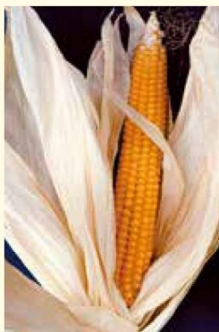
ポップ種のポップコーン

バイカラー系品種は、黄色と白色の親を掛け合わせて採種されていて、播種するF1の子供の代である種は黄色粒ですが、食べる種は孫の代で黄色と白色粒の比率が3:1となっており、黄色が単一優性遺伝しています。