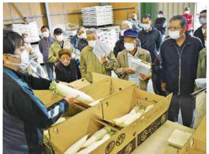
ダイコンの規格について確認する生産者

同組合では、つや風をはじめとして7品種の春ダイコンを生産しており、出荷量は県内一位を誇ります。出荷は4月中頃から6月中旬まで行われる予定です。