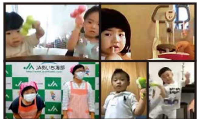
オンラインで参加いただいたご家族の皆さん