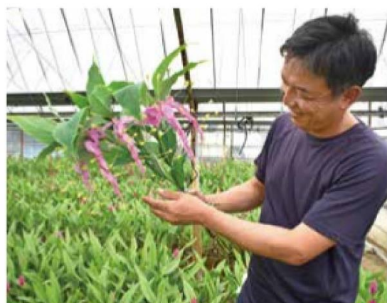
グロッバなどの珍しい花も多く手掛ける

今後の展望については、「カラーや花菖蒲、花ハスなどの地域特産の花卉を継続的に栽培しながら、新たなニーズにも対応していかなければなりません。花は流行が大きく変動する作物です。私が就農した当初の今から20年ほど前は、大きな花が好まれました。その後、徐々に小ぶりなものが求められるようになり、10年ほど前からは自然風な緑の草花に注目が集まるようになりました。そして現在は、月額制で定期的季節の花が自宅に届くサブスクリプションが