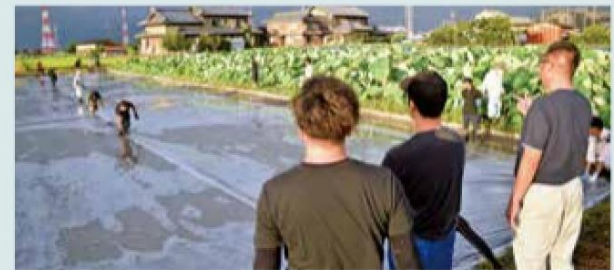
農業用フィルムをレンコン田に張る様子

徳島県では、一反当たりの収量が2倍近くに改善した事例もあり、来年の収穫に向けて効果が期待されます。