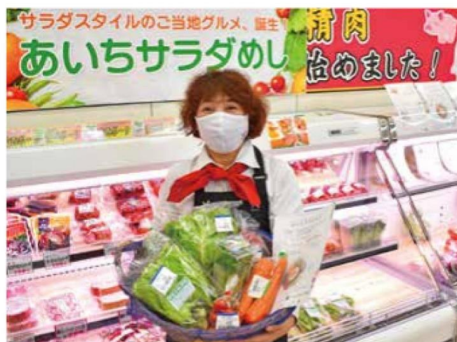
サラダめしセットを紹介する野菜ソムリエ

今後も当JAでは、産直施設を消費者と生産者を結び場と位置づけて、地域農業の発展に向けてPR活動を継続的に行ってまいります。