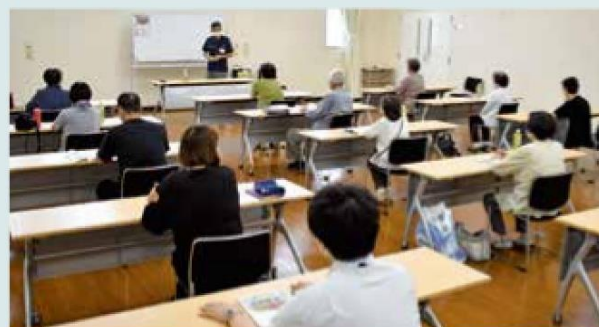
熱心に受講する参加者

また、秋冬野菜のシーズンに向けて、ジャガイモやハクサイ、ブロッコリー、キャベツなどの育て方についても解説し、参加した方々は熱心に耳を傾けていました。