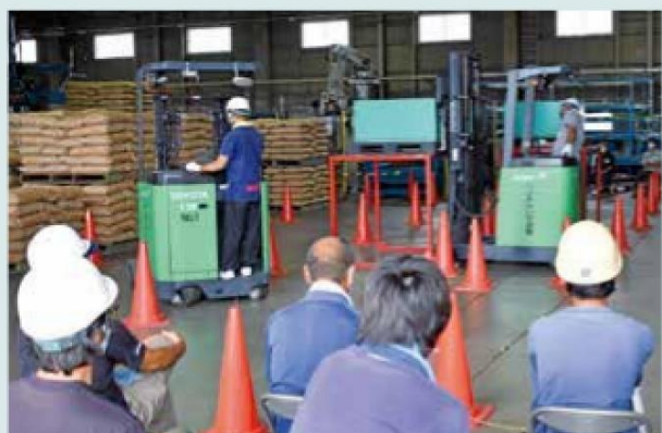
実地講習を受ける参加者

8月31日、トマトセンターでフォークリフトの運転講習会を開催し、海部トマト部会の部会員18名が参加しました。