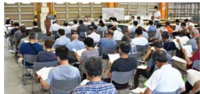
議案説明を聞く参加者

令和3年度も引き続き、あまイチゴ組合「ゆめのか」の認知度向上や販売力強化に取り組んでまいります。