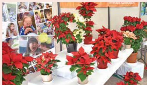
本店ロビーに展示されたポインセチア

11月24日から年末にかけて、蟹江町花き部会は本店と蟹江支店で、冬季の特産品であるポインセチアの展示会を行いました。今年は新型コロナウイルスの感染拡大による各種催事の中止により、花きの需要が大きく落ち込んでいます。この取り組みは、来店者の方々に特産花きの魅力を伝えることで、需要喚起につなげたいとの同部会の依頼を受けて実施しました。