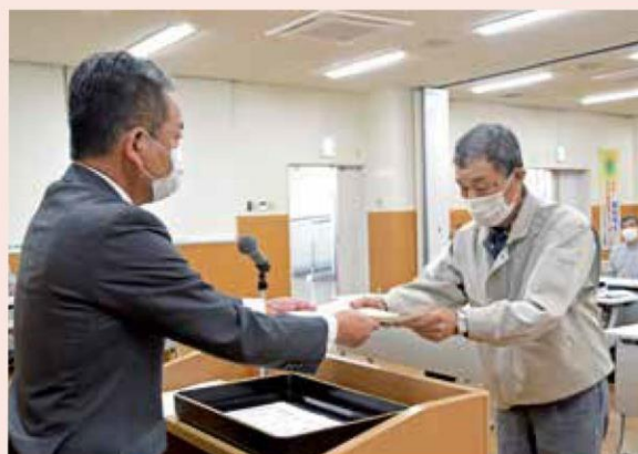
城常務から修了証を受け取る受講生

12月8日、南部営農センターで産直会員育成講座「就農塾」の閉講式を行い、受講生19名が修了しました。今年度の受講生のうち、現在10名が産直会員となって出荷しており、店舗活性化に繋がっています。