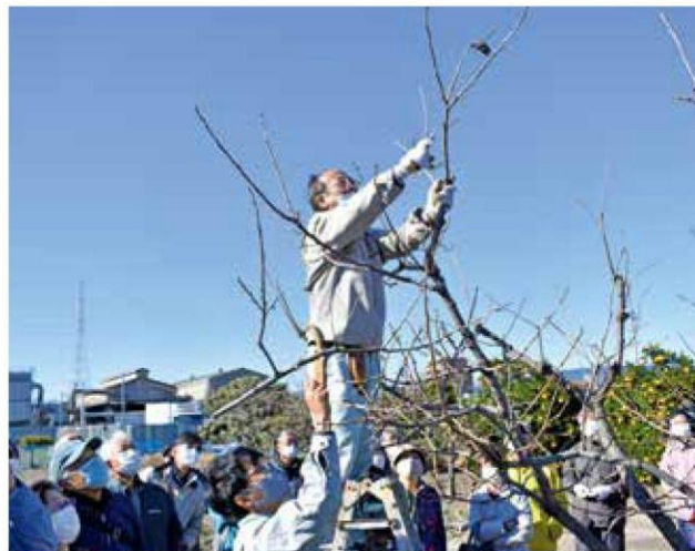
講師が実演する様子を眺める参加者

12月4日、南部営農センターで果樹の剪定教室を開き、87名が参加しました。同教室は2006年から毎年開催しており、これまでのべ2,000名以上が参加している人気教室です。