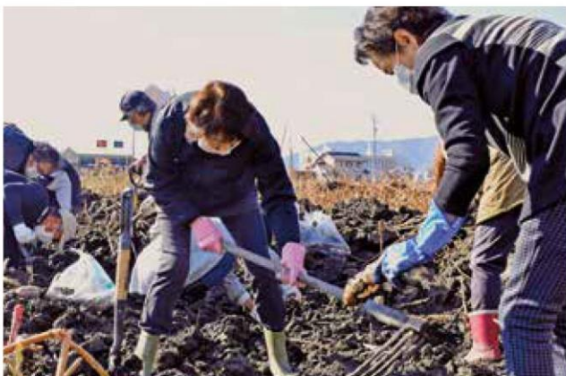
レンコン掘りを体験する参加者

この日は当JA管内特産のレンコンの収穫体験を行いました。参加者は、クワを使って地中からレンコンを収穫する地域伝統の土掘りを体験。作業の難しさや農家の苦勞を知り、地元特産物への理解を深めました。