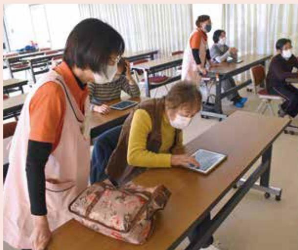
タブレット端末で記憶ゲームを行う参加者

この日は10名が参加し、画面に出た複数の絵を記憶してタブレット端末に名前を書くトレーニングや、干支の丑を新聞紙を使ったちぎり絵で表現した年賀状を作りました。