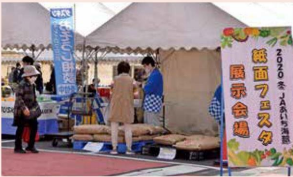
特設テント会場の様子

2日間のセールでは、同フェスタのポイント還元商品の展示会や各種売り出しを行ったほか、当JAのポイントカード会員加入やLINEの友だち登録キャンペーンも行い、合わせて100名以上の方にご加入またはご登録いただきました。