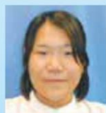
脳卒中リハビリテーション 看護認定看護師