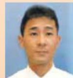
地域包括支援センター長