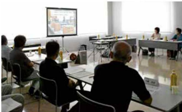
自己改革の取り組みをまとめたDVD映像を視聴する委員