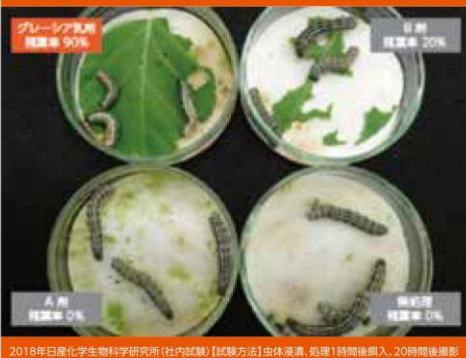
2018年日産化学生物科学研究所(社内試験)【試験方法】虫体浸漬、処理1時間後投入、20時間後撮影