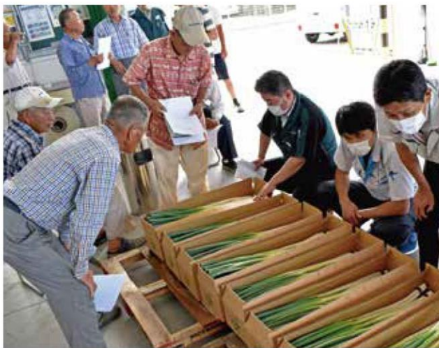
品質を確認する生産者と市場関係者ら

同部会は35戸がおよそ3ヘクタールで栽培しています。出荷は10月まで続き、中京方面に総計18,000ケース(6* 0 /ケース)の出荷を目指しています。