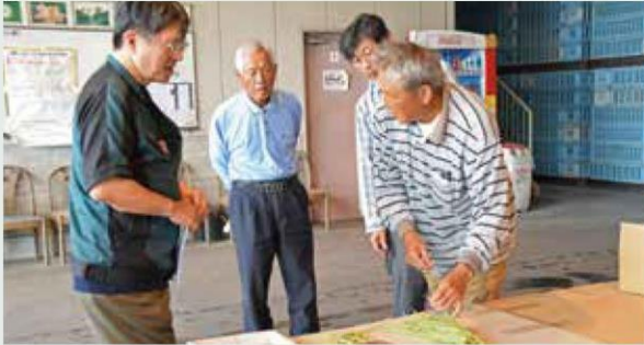
入念に規格の確認を行う生産者と市場担当者

6月18日、立田ささげ組合はれんこんセンターで、出荷規格の統一と品質向上を目的に、ささげの目揃え会を開きました。目揃え会には市場担当者やJA担当者を含めた7名が参加し、サンプルを使いながら、曲がりや擦れ、長さなどの出荷基準や規格を念入りに確認しました。