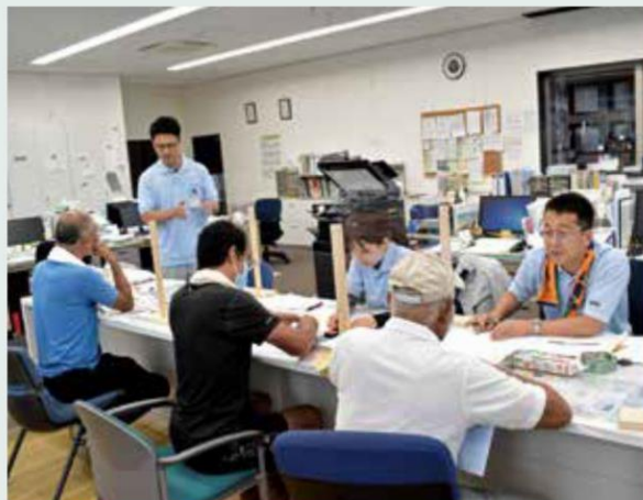
組合員の相談に答えるJA職員

担当した職員は、制度の概要や留意点、必要書類などについて、組合員に丁寧に説明しました。