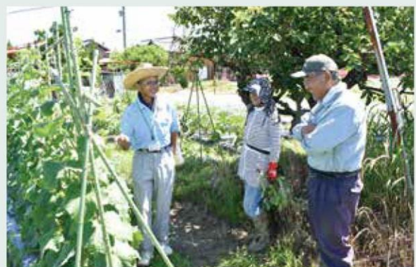
キュウリの育成について確認する営農主幹(左)と塾生

参加した塾生からは病害虫防除や栽培管理について質問が出され、営農主幹は一つ一つ丁寧に答えていました。