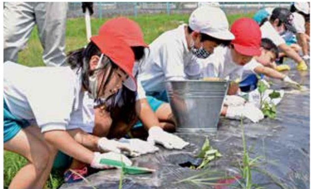
サツマイモ苗を植えつける児童たち

担当した園芸部園芸企画課職員は「今年はコロナ禍の影響で出前授業がほとんど中止となってしまい残念です。今回の体験を通して、子どもたちが農業へ関心を高めてもらうきっかけになれば」と話しました。