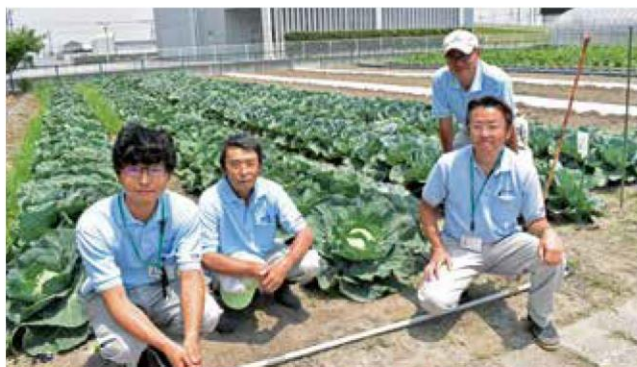
納品したキャベツと、栽培を担当したJA職員

担当した園芸部園芸企画課職員は「愛情を込めて育てた野菜をたくさん食べていただき、地域農業に少しでも関心を持ってもらえれば」と話しました。